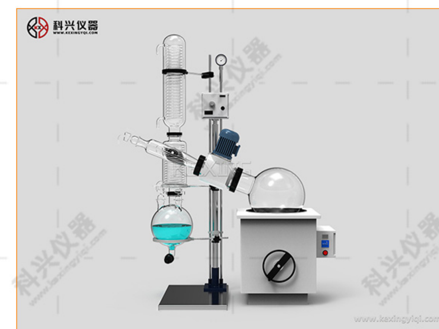
旋转蒸发仪(防爆型)