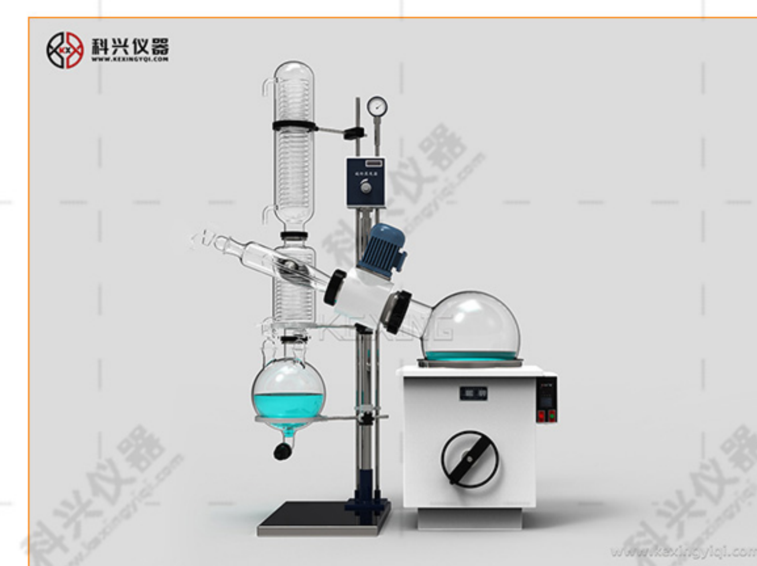
旋转蒸发仪(标准型)