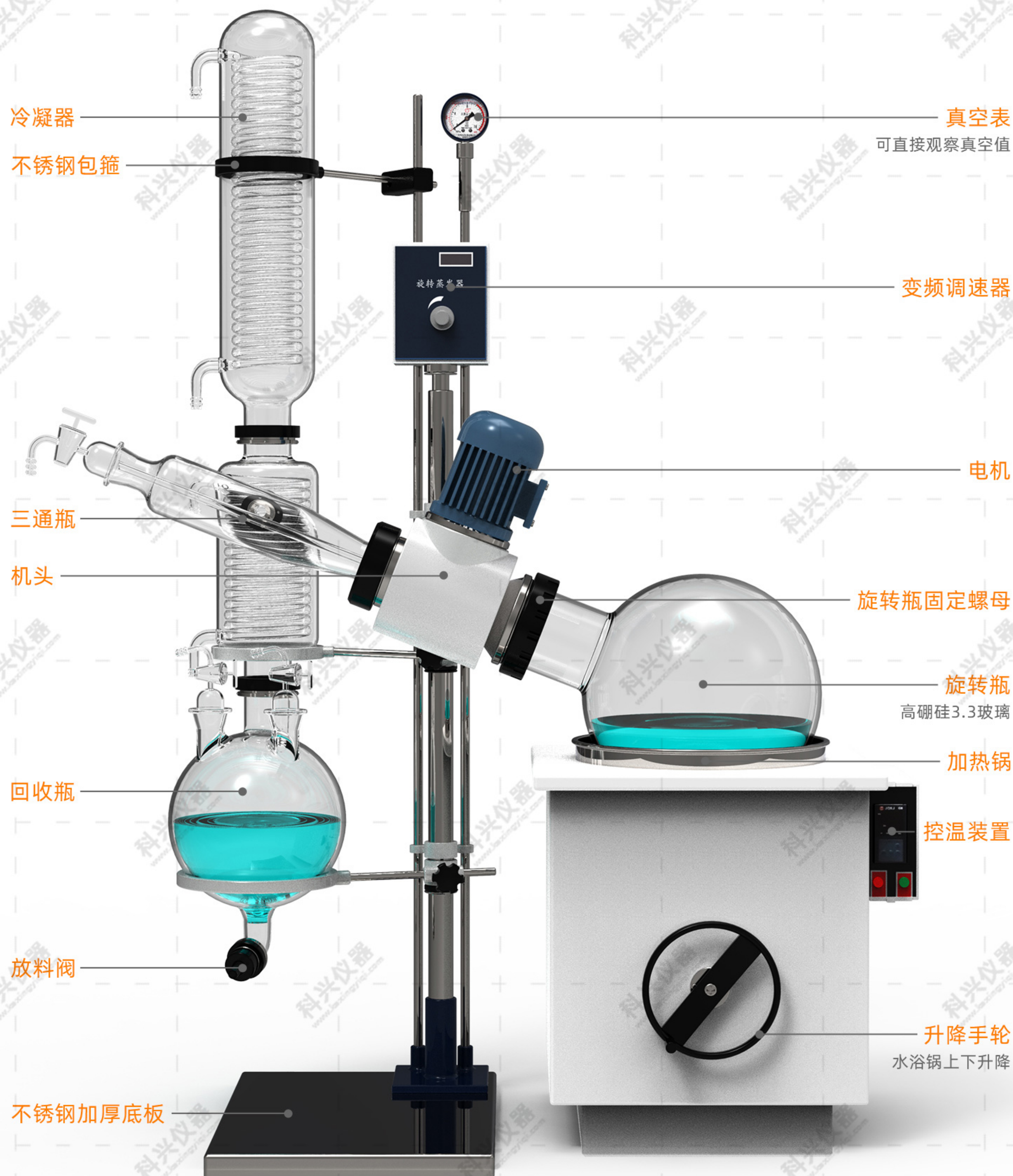
旋转蒸发仪大型(标准型)